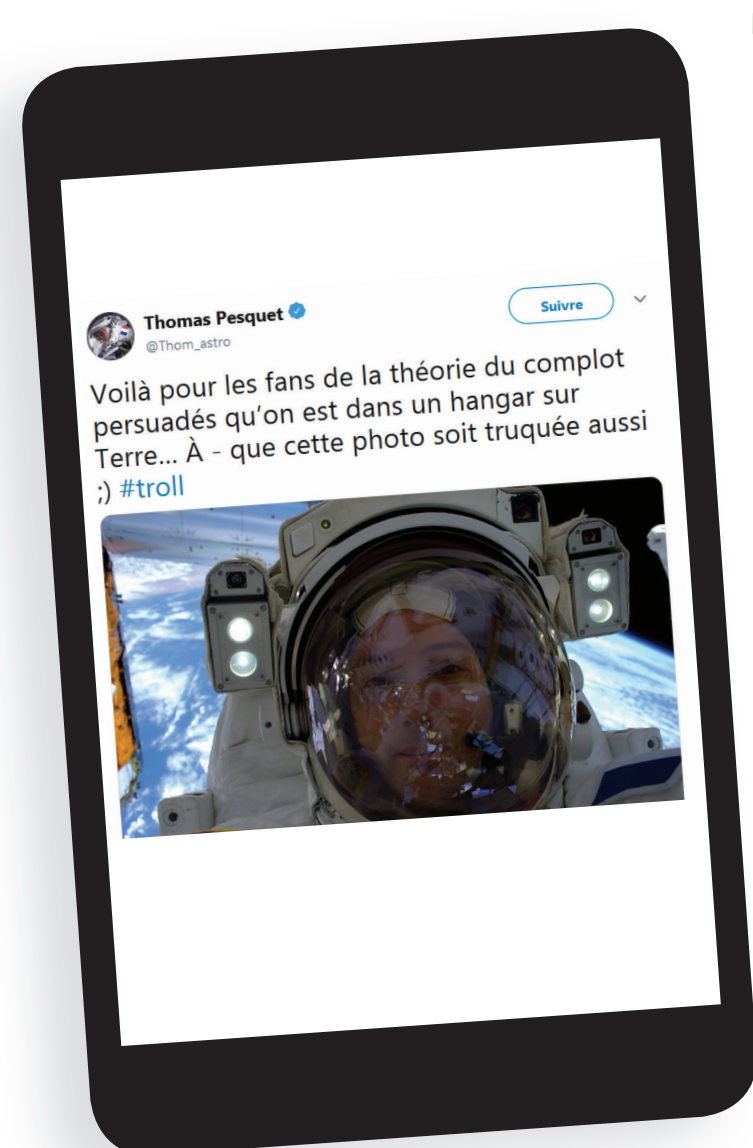
twitter.com, 23 février 2017, message @Thom_astro

son esprit critique quand règnent des enjeux économiques internationaux, la complexification de l'information, la banalisation de certaines croyances ? De plus, la diffusion virale sur Internet (sites, blogs, réseaux sociaux) ne permet plus la vérification des faits en temps réel.